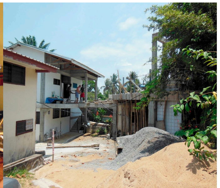
— L'AMÉNAGEMENT DE MON NOUVEL HABITAT À KRIBI