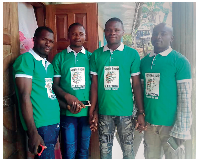
— LE COMITÉ DES ANCIENS APPRENTIS DU CENTRE D'EBOWLA

Pour 2019, le challenge d'Apprentis Du Monde sera en plus du soutien des structures en place au Cameroun, la création d'un centre de formation à Yaoundé, avec comme partenaires, l'association des anciens apprentis de Masih Iqbal (menuiserie et maçonnerie).