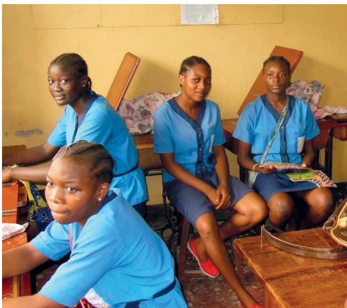
— POSE POUR LES ÉLÈVES DU CENTRE STE-FAMILLE À DOUALA

Vos questions sont légitimes, tout comme elles le sont sur le terrain. Il n'y a pas de place pour le rêve, mais seulement pour la réalité. Dans les situations très peu stables dans lesquels les Centres agissent la direction et ADM se repositionnent sans cesse en fonction des événements afin de poursuivre leur action. Nous nous efforçons de garder le cap, à savoir offrir une bonne formation à la jeunesse afin qu'elle bénéficie d'un avenir plus humain et plus heureux. Nous avançons en évitant les gros pièges qui peuvent tout anéantir. ADM et toutes les personnes qui se mettent au service de cette population n'ont qu'un objectif : rester au poste et avancer malgré les embûches. Nous essayons toujours de voir le positif dans chaque situation afin de réaliser notre travail au mieux. La joie des jeunes et votre soutien nous motivent à continuer notre mission.