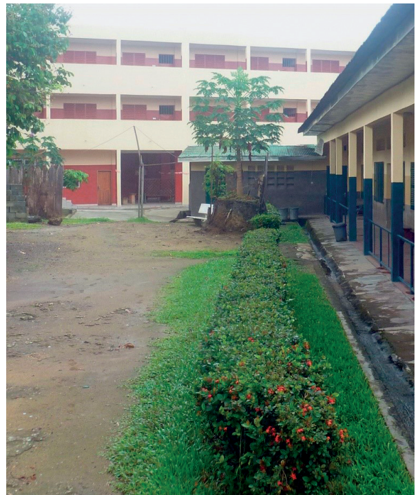
— L'ANCIEN CENTRE AVEC LE NOUVEAU BÂTIMENT EN ARRIÈRE-PLAN

L'horizon 2019 n'annonce aucune accalmie... L'orage est là mais nous n'allons pas fuir notre travail. Nous nous mettons à l'abri et attendons.