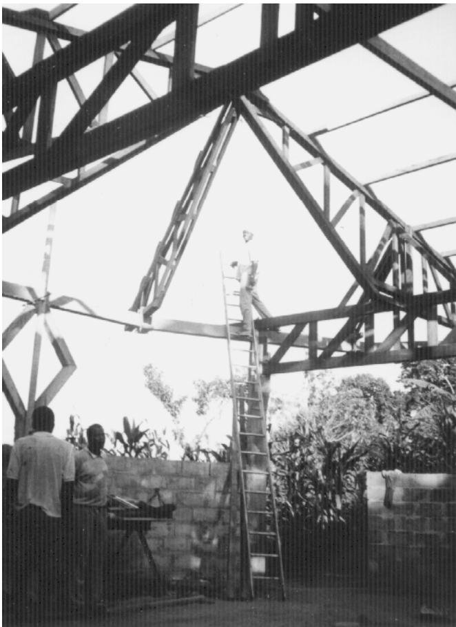
Montage charpente de l'atelier - Etat Juin 1999

Consolider les moyens pour une bonne formation des 15 et plus tard 30 apprentis c'est notre première priorité. Et cela en dépendant des dons qui nous parviennent. Au niveau constructif de la 2 ème étape comprenant le réfectoire et la cuisine, ceux-ci seront terminés en septembre 2000. Quant à l'atelier, sa construction est terminée et son aménagement se fait à mesure de disponibilité de notre association. Toutefois l'association fera son possible pour maintenir l'ouverture complète du centre prévue en 2001.