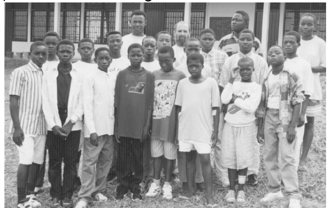
La 1 ère volée d'apprentis à Abong-Mbang - 1999

La politique d'Apprentis Du Monde à long terme consiste à mettre en place des centres d'apprentissage qui seront gérés par la suite, par des personnes provenant du milieu local, avec supervision de l'association. Avec le centre "Masih Iqbal", c'est déjà le début de cette expérience. Par ce mode de procéder, et surtout avec votre précieux soutien, l'association pourra permettre à un plus grand nombre de jeunes défavorisés d'acquérir un métier pour ne plus être à la charge de la société.