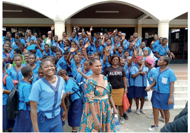
→ ELÈVES DU CENTRE

Cette année deux cent cinquante élèves se sont inscrites en filière couture et cinquante en filière esthétique.